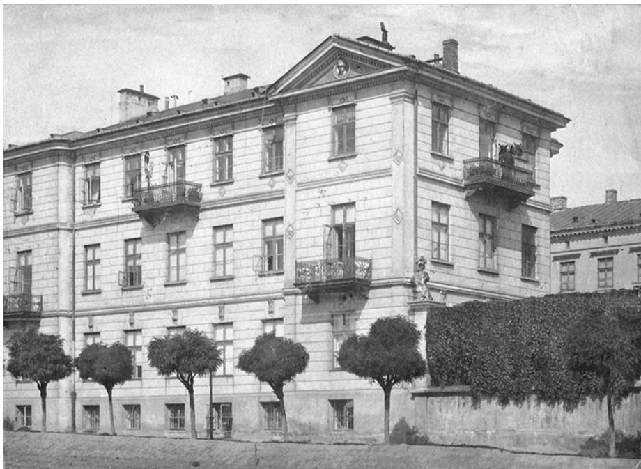
1096 r. Pierwsza siedziba przy ul. Smolnej

praw szkół akademickich państwowych Uczelnia uzyskała osobowość prawną, a jej absolwenci, poza dyplomem zawodowym, mogli uzyskać tytuł magistra, a także stopień doktora nauk ekonomicznych 2 . Dyplomy WSH zrównano z analogicznymi dokumentami szkół państwowych.